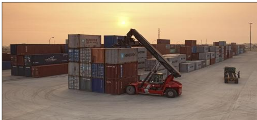
Gambar 4 : Pelabuhan Darat

Permohonan adalah daripada MOT, mana-mana agensi lain yang berkaitan atau mana-mana pihak yang dilantik.