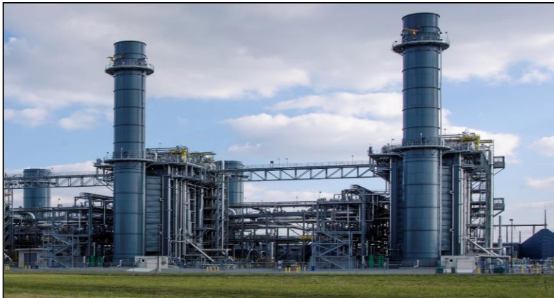
Gambar 7 : Loji Jana Kuasa

Permohonan adalah daripada KeTTHA, TNB, agensi nuklear, mana-mana agensi lain yang berkaitan atau mana-mana pihak yang dilantik.