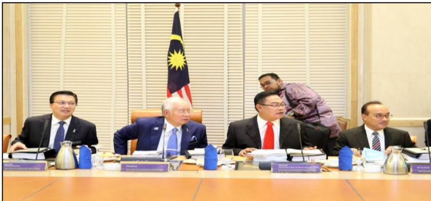
Gambar 10 : Mesyuarat MPFN

Istilah “2 negeri” dalam bab 4.0 merujuk kepada semua Negeri-Negeri Persekutuan di Semenanjung Malaysia dan termasuk Wilayah Persekutuan Kuala Lumpur dan Putrajaya.