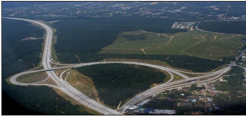
Gambar 6 : Rangkaian Lebuhraya

Permohonan adalah daripada KKR, LLM, mana-mana agensi lain yang berkaitan atau mana-mana pihak yang dilantik.