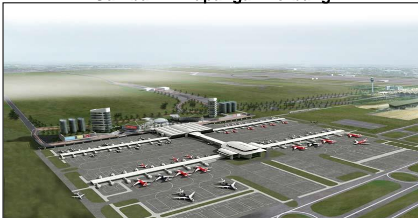
Gambar 2 : Lapangan Terbang

Permohonan adalah daripada MOT, MINDEF, mana-mana agensi lain yang berkaitan atau mana-mana pihak yang dilantik.